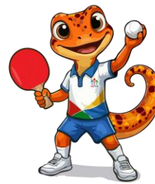
TENIS DE MESA