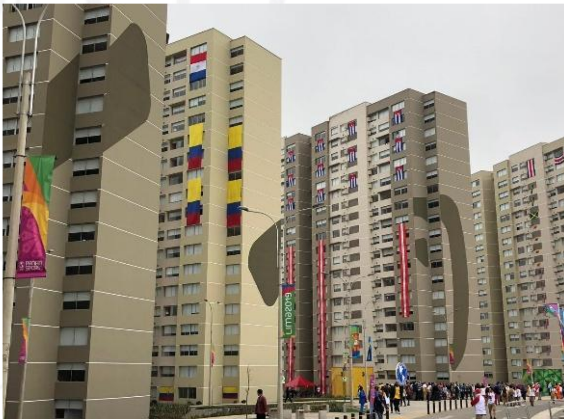
Villa Panamericana – alojamiento principal de las delegaciones.